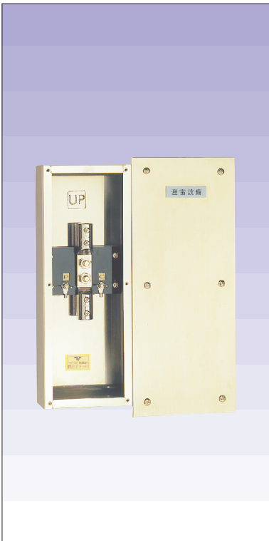
試験用端子函埋込型 (黄銅製ホワイトブロンズメッキ仕上) 品番 632