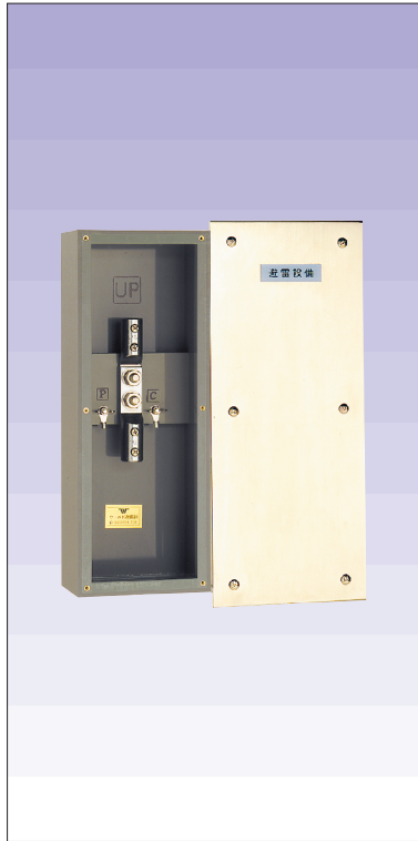
試験用端子函埋込型 (ボックス硬質ビニール製、プレート 黄銅ホワイトブロンズメッキ仕上) 品番 615