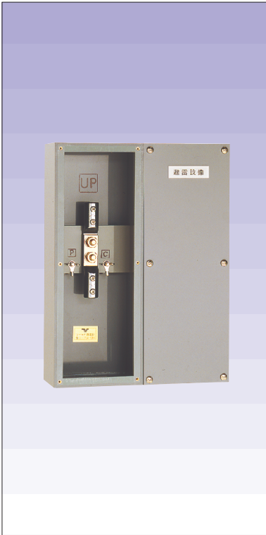
試験用端子函露出型 (硬質ビニール製) 品番 601