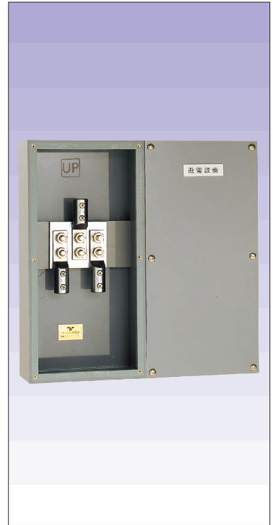
中継用端子函露出型3端子付 (硬質ビニール製) 品番 605